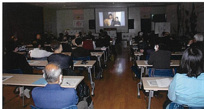
第3回定例研修「面接」のビデオを鑑賞