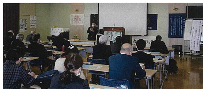
第3回定例研修「面接について(面接技法)」