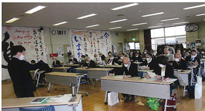
第2回定例研修「被害者等の心情を踏まえた保護観察処遇」

第三回定例研修・・・令和4年3月16日(水)実施。インターン2名参加。コロナ禍の為出席減は致し方なしです。